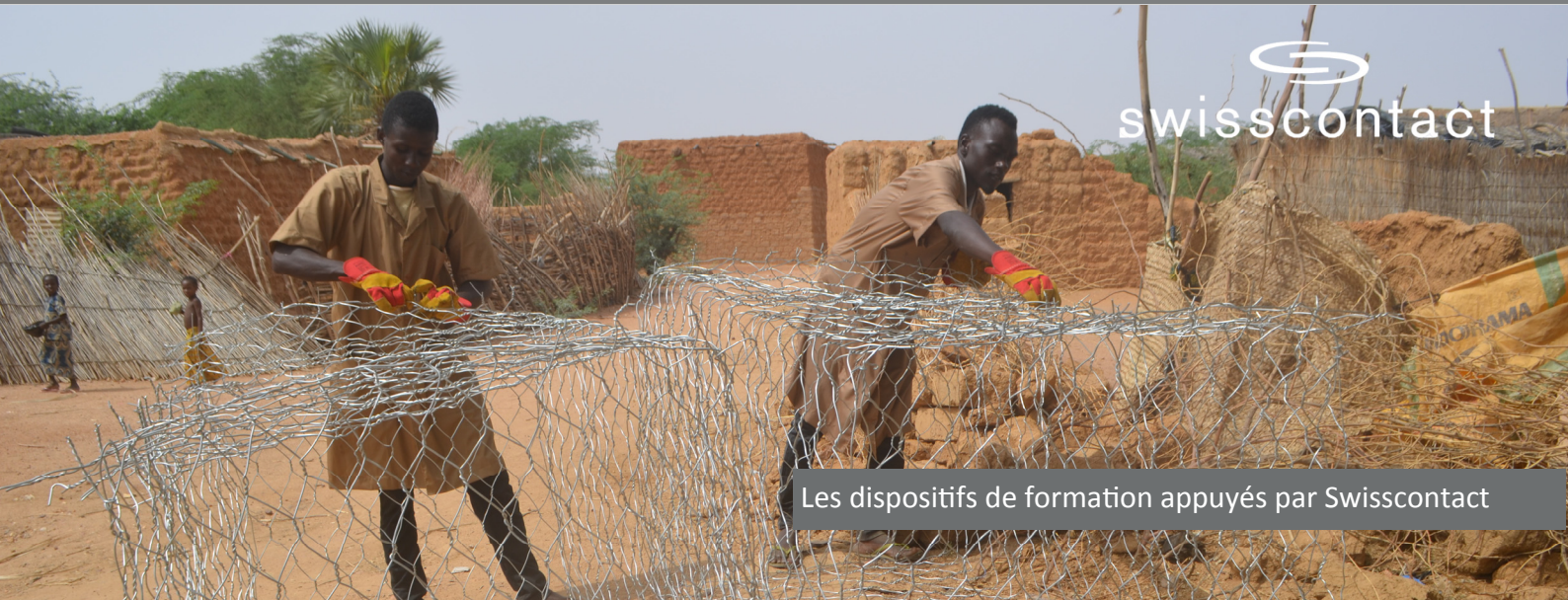
Les dispositifs de formation appuyés par Swisscontact

Le cash for work - chantier école Une formation de courte durée directement liée à l'emploi et génératrice de revenus